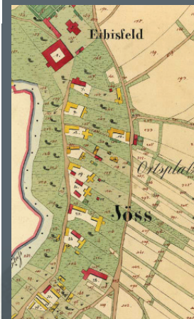
Eybesfeld und Jöss auf der Riedkarte zum Kataster des Jahres 1823.