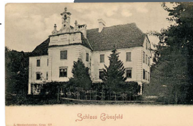
Schloss Eybesfeld, um 1900. StLA