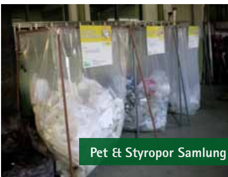
Pet & Styropor Sammlung

Samstag, 16.4.2011 Frühjahrsputz 9:00-12:00 ASZ