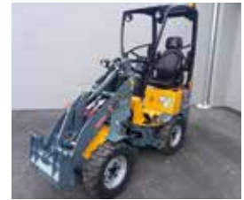
Giant G1200HD BJ 2022, 25 PS, 5H € 29.490,-

Allgemeine Anfragen bitte direkt per E-Mail an verkauf.landmaschinen@gady.at oder telefonisch an 03182 2457-501025 Franz Gady GmbH • Leibnitzer Straße 76 • 8403 Lebring • Austria • Fon +43 3182 2457-0 • info@gady.at • www.gady.at