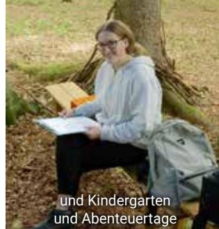
und Kindergarten und Abenteuerstage