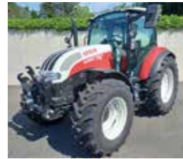
Steyr Kompakt 4080 BJ 2022, 3H, 80 PS € 62.900,-