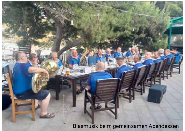
Blasmusik beim gemeinsamen Abendessen