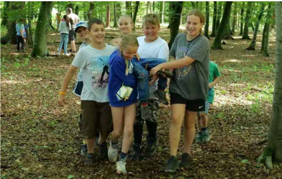
Die Abenteuerstage in Lang waren wieder ein voller Erfolg!

Der Sommer stand wieder ganz im Zeichen der „Sommerhits für Kids“, dem Hengist-Ferienprogramm für Kinder und Jugendlichen von 6 bis 15 Jahren. Auch heuer fanden wieder folgende vom Kulturpark Hengist organisierte Aktionen statt: Zweimal Walderlebnistage in Hengsberg, Abenteuerstage in Lang und fünf kreative Workshops (Kräuterwanderung, -küche, -kosmetik, Papier, Malen) in Wildon. In Kooperation mit der Wildoner Schlossbergbühne gab es heuer zwei ausgebuchte Theaterworkshops. Die Präsentation des ersten Workshops erfolgte im Rahmen der 50-Jahr-Feier der Wildoner Schlossbergbühne.