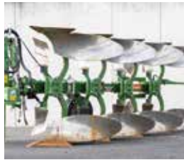
Amazon Pflug Cayros XMS 4-Schar Vario BJ 2018, Vorführpflug € 13.950,-