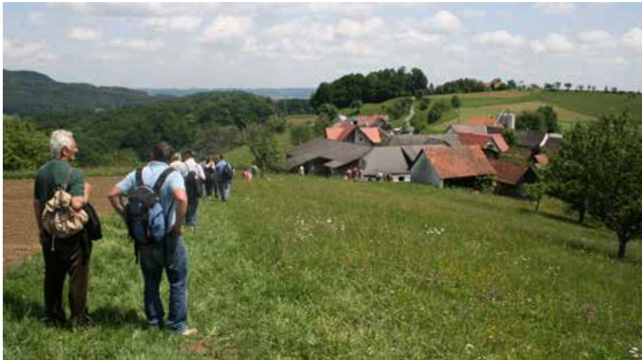
Am 7. Oktober ist eine Lechenburgwanderung geplant!