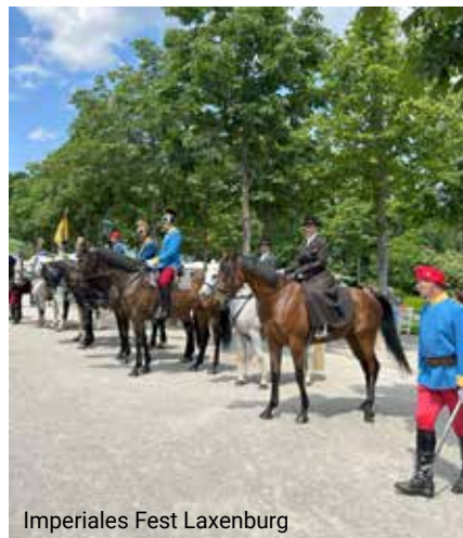
Imperiales Fest Laxenburg