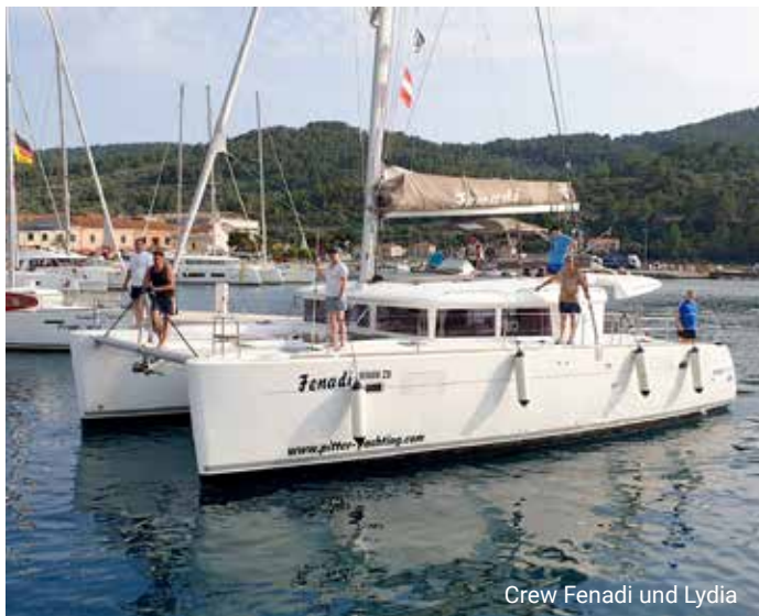
Crew Fenadi und Lydia