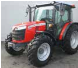
Massey Ferguson 4708M BJ 2023, 5H, 82 PS € 53.990,-